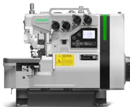
ZOJE ZJ-B9500-13-PD3-02 SET