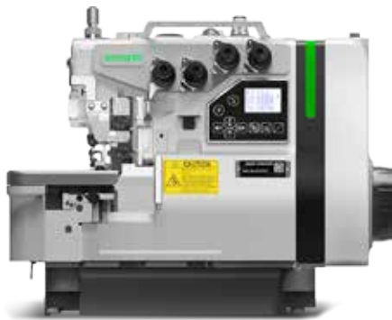
ZOJE ZJ-B9500-13-02 SET